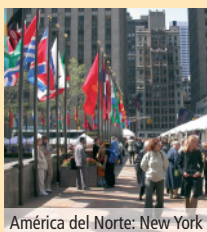
América del Norte: New York